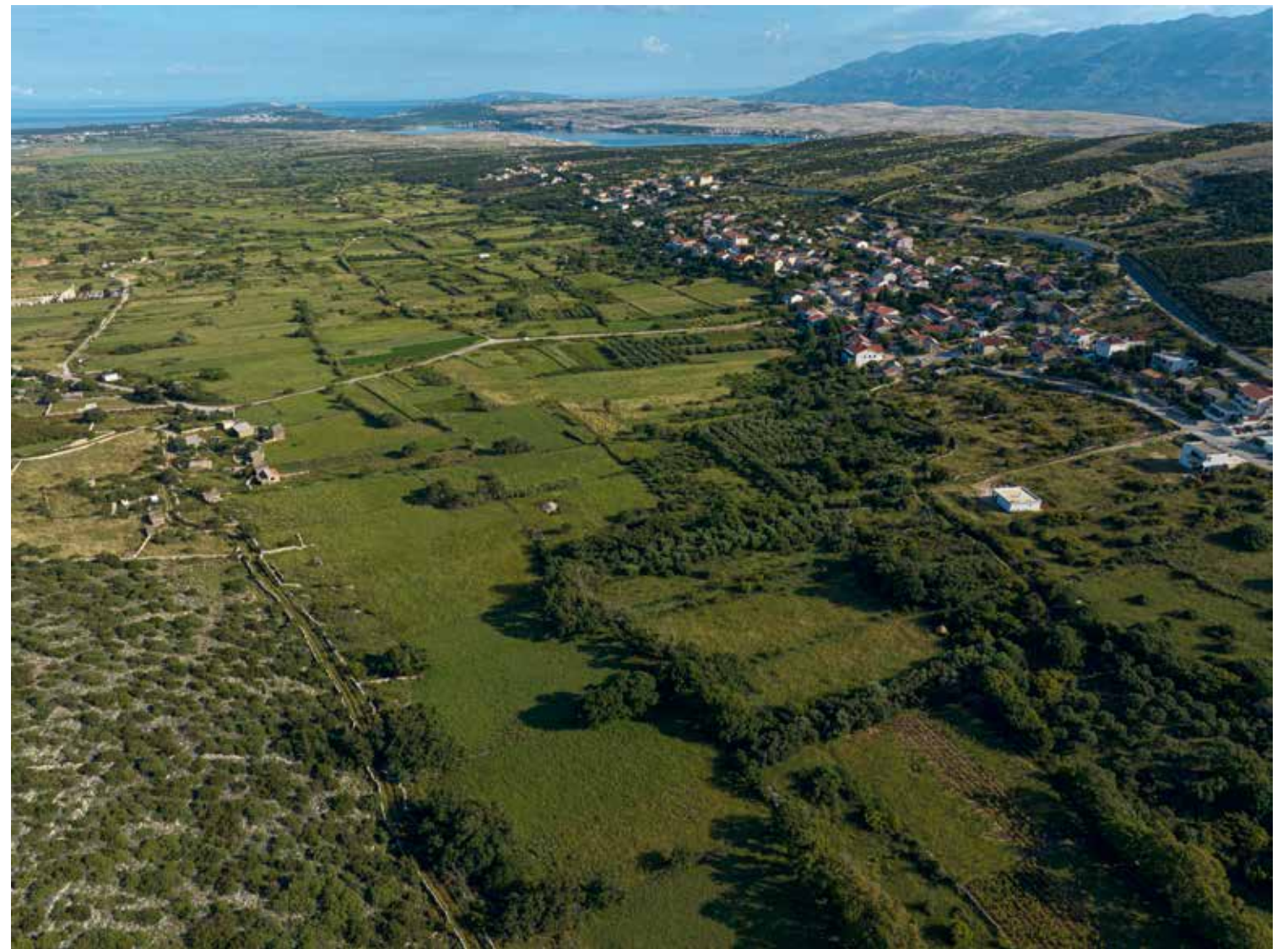
Zelena Kolansko polje gotovo je u cijelosti prepušteno ovcima. Kuće njihovih vlasnika su ponad polja

polju ili kamenjaru. Gromače kojima je premrežen čitav otok i koje se nerijetko poput onih kornatskih spuštaju sve do mora drže stada na okupu. U ovo doba godine većina janjaca već je slavu paške janjetine platila glavom, ali još uvijek traje mužnja. Jer od njihovog mlijeka dobiva se, uz sol, najpoznatiji otočki proizvod – paški sir. Sir su uobičajeno radili