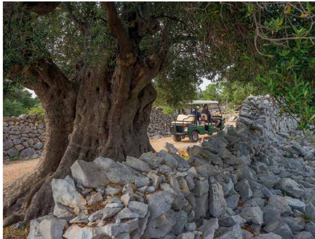
Lunske maslinike ovdašnji svijet njeguje s mnogo volje i ljubavi

U naravi paški akvatorij pripada onima u koje nautičari znatno manje zalaze. Njihovi puti od sjevera prema jugu vode pretežno uz vanjski niz otoka od Lošinja prema Dugom otoku. Oni što tako plove iz kvarnerskih marina drže se Kvarnerića. Jednako kao i oni što kreću iz luka iz Vinodolskog kanala koje usput privuku uvale rapskog Kalifronta i čarobni grad Rab. Tako jugozapadna obala Paga ostane nekako po strani. A ona sjeveroistočna okrenuta Velebitu i buri još i više jer to je jadranski prostor kojim se bez sumnje najmanje plovi. Izuzmemo li Novalju i marinu u Šimunima, niti u luke i lučice ovdje se nije značajnije ulagalo. Slobodnih vezova za tranzit zbog toga nema previše, a ove godine zatvorena je i jedina benzinska postaja za nautičare. Stoga radi tankiranja valja poći put Raba (20 NM) ili Zadra (18 NM). Ima li smisla onda doploviti do otoka soli, ovaca, sira, a posljednjih desetljeća i neobuzdane zabave? Ima, itekako. Jer baš se s barke može doživjeti Jadran različit od onog na koji smo navikli. To što ćemo se vjerojatno morati potruditi oko pronalazaženja veza, voditi više računa o vremenskoj prognozi i utrošku goriva ne bi nas trebalo previše pokolebati u tom naumu. Na kraju ćemo biti bogato nagrađeni. Moći ćemo doživjeti lunske maslinike nakon što smo pristali u nekom portiću tog poluotoka što se poput ispruženog prsta uperio k Rabu. Onaj tko želi vidjeti kako se zabavlja na Ibizi odabrat će Novalju i obližnje Zrće. U gradu Pagu, jedinstve-