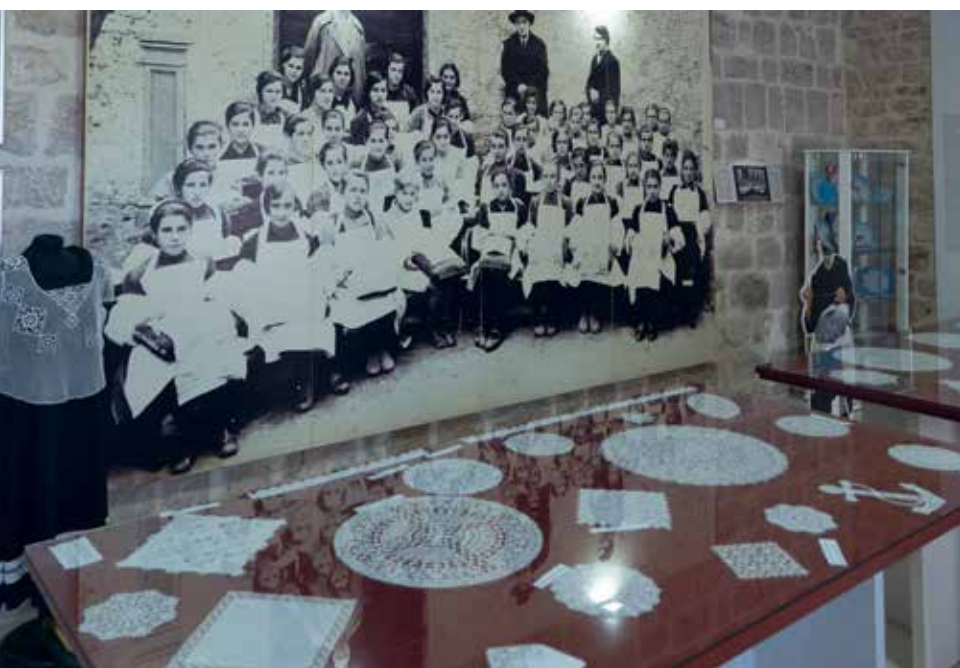
Muzej paške čipke na glavnom gradskom trgu