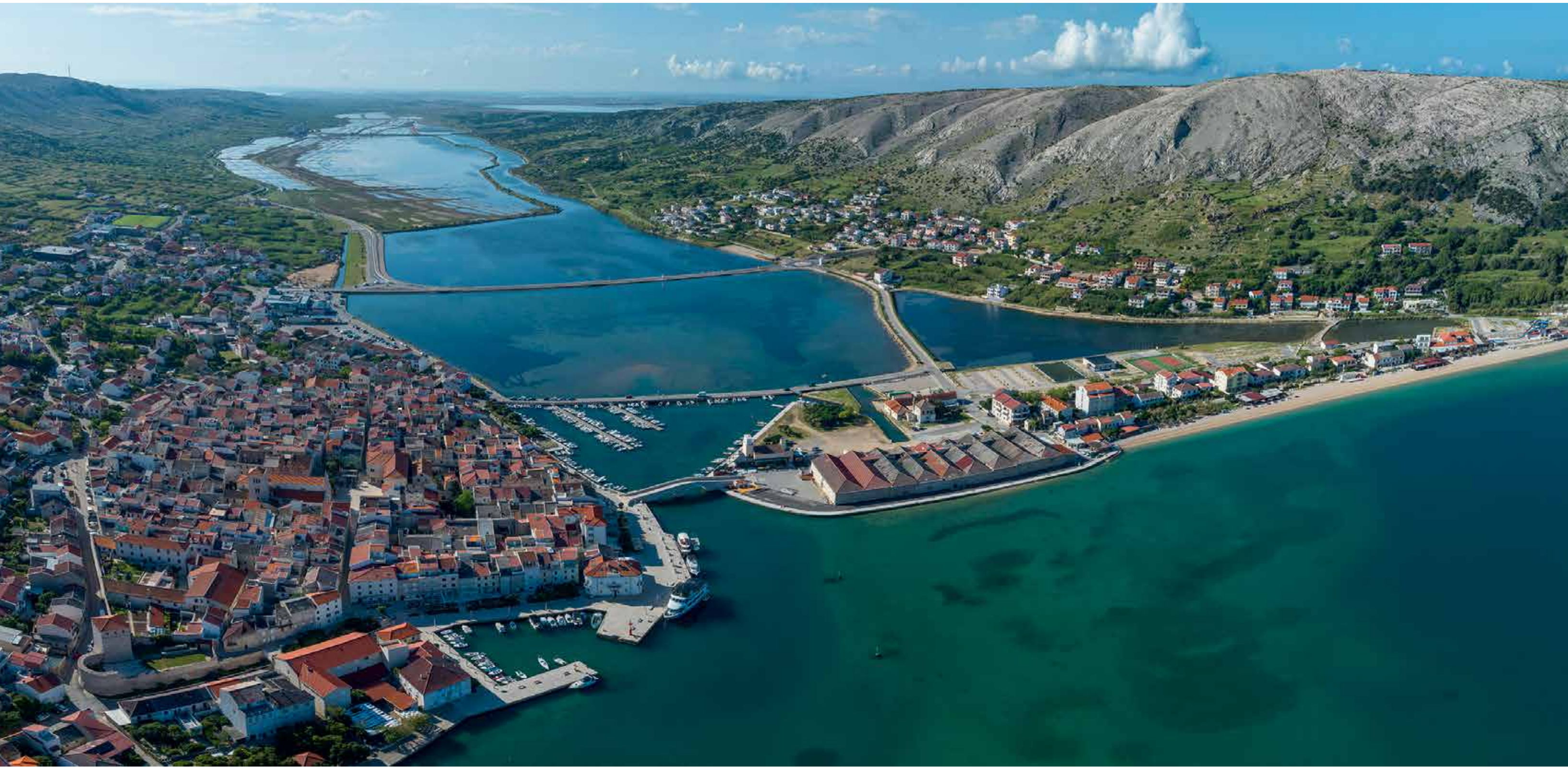
Pag sa sačuvanom renesansnom jezgorom pravilnog urbanističkog rastera i najvećom jadranskom solanom u pozadini