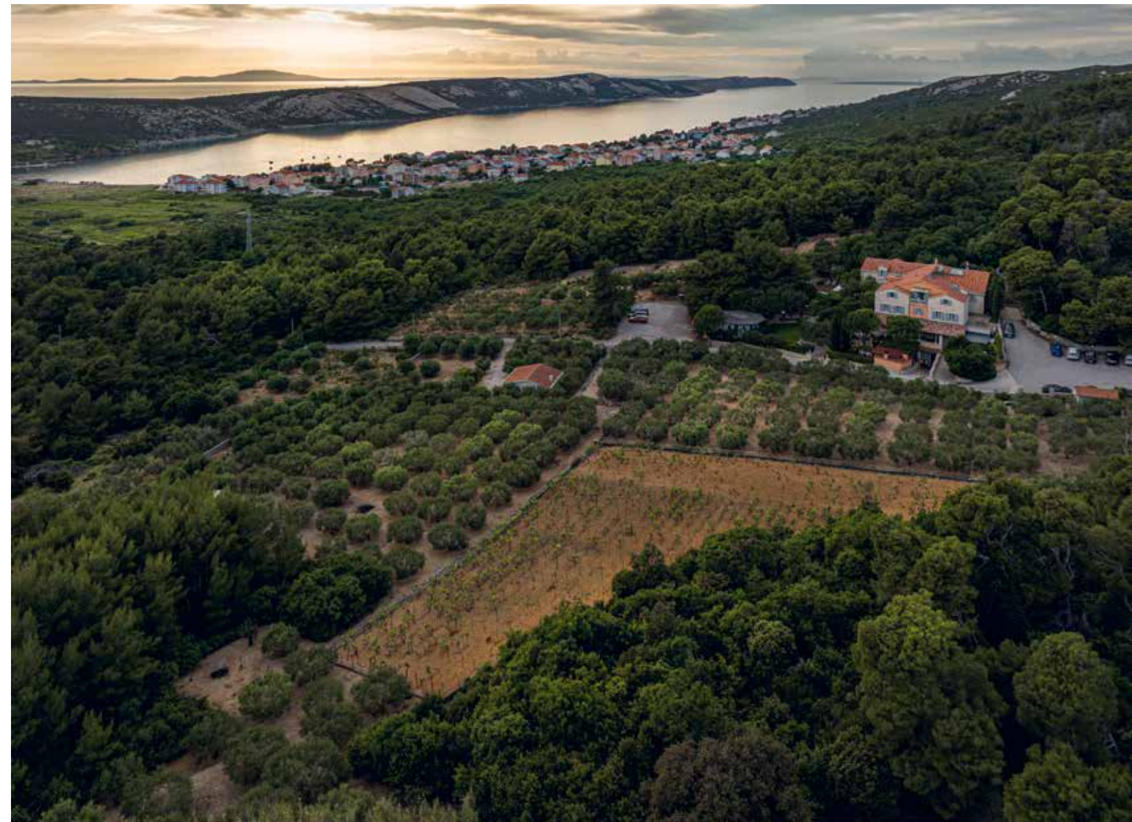
Posjed Boškinac s ekskluzivnim restoranom i hotelom s pet zvjezdica

„Čudo ovih maslinika je ljudsko djelo. Tamošnji stanovnici sačuvali su ih od uništavanja, sječe i požara, a maslina je za opstanak na surovu, kamenitom, moru okrenutom, burom šibanom tlu bila sposobna i sama. A onda je na scenu ponovno stupio čovjek. Brinuo je o njoj, obrezivao ju, dovodio ovce da je gnoje, osvajao nove prostore nasada gradeći kilometre i kilometre visokih suhozida s ozubom na vrhu da ih ne bi preskakale, uređivao pojilišta i ograđivao 'vrtiče' s bajamima i smokvama među njima, stizao u vrijeme kad dozrije za berbu uz mnogo