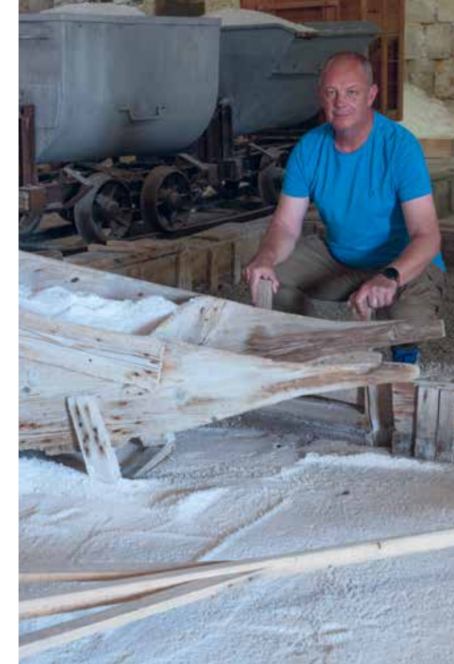
Stari grad Pag: Crkva sv. Marije i ruševine Franjevačkog samostana