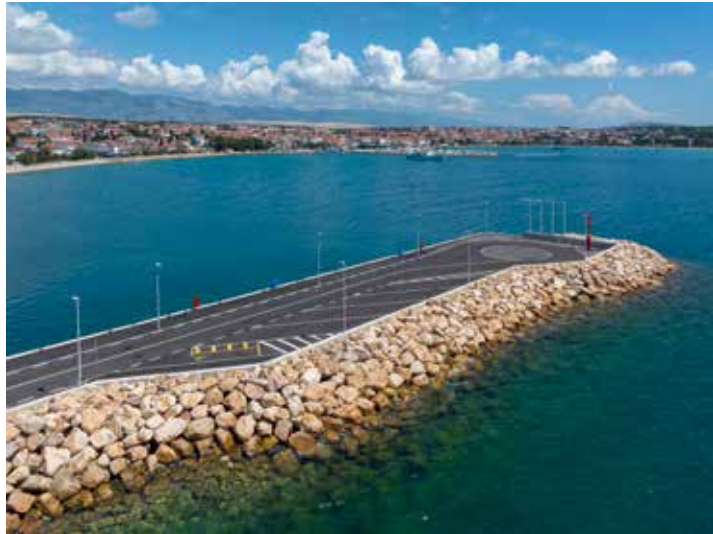
Gat nove ribarske luke u Novalji bio je prazan u doba punog Mjeseca kad plivaričari ne izlaze na more

Vezovi za brodice domaćih ljudi uz koje se nađe i pokoje mjesto za nautičare koji bi na dan ili dva pristali u Novalju