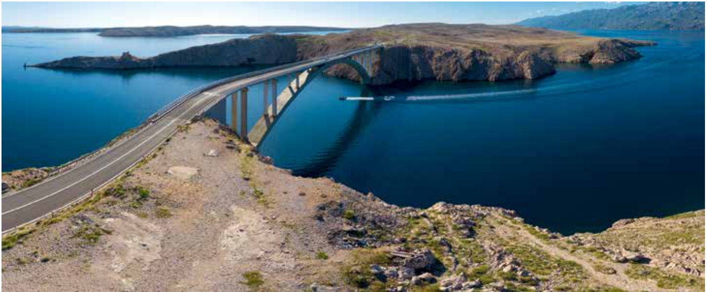
Koliko god je lijepo do Paga doploviti, većinom se na otok stiže preko mosta kojim je spojen s kopnom

možemo se usidriti pred nekim žalom, poći ostavivši po boku ubava naselja Metajnu, Zuboviće, Kustiće i Vidaliće do Caske i zapadne obale zaljeva pa usidriti pred Zrcem i prepustiti se ritmu tamošnje zabave. Učini to najveći broj jahti, često i pedesetmetarskih koje kroz Paška vrata uplove.