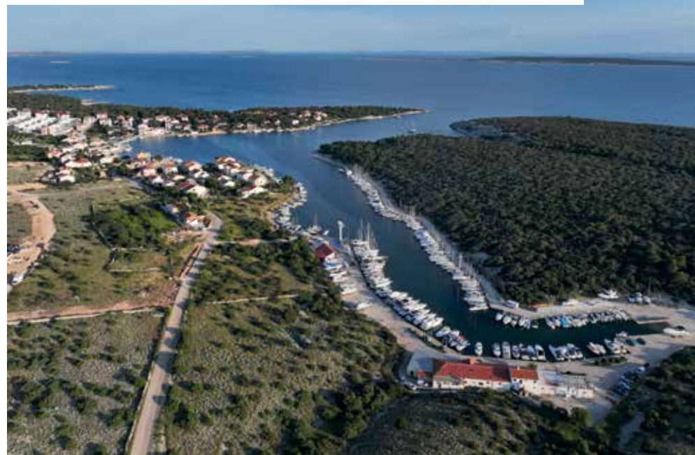
Marina Šimuni smještena je u sjeverozapadnom kraku dobro zaštićene uvale

mjeru zaploviti Velebitskim kanalom dalje oko sjeverne obale otoka. Stara Novalja je danas sve samo ne stara. Nekadašnje minijaturno naselje pružilo se u tri reda novosagrađenih poprilično velikih kuća puna tri kilometra uz sjevernu obalu uvale, skoro sve do trajektnog pristaništa. Srećom, plaža u dnu uvale i čitava južna obala ostale su netaknute. Nama koji bismo ovdje doplovili Stara Novalja ne pruža mnogo. Mjesta za vez u naselju nema. Naravno, u 2,2 milje dugačkoj uvali pri njenom kraju moguće je sidriti i biti zaštićen od bure, ali ne i od tramuntane. Uz trajektno pristanište pod rtom Deda je i riva gdje se veže desetak brodova i plato na koji se izvlače i uređuju brodovi. I njime upravlja lučka uprava i ponekad je moguće i tamo naći vez.