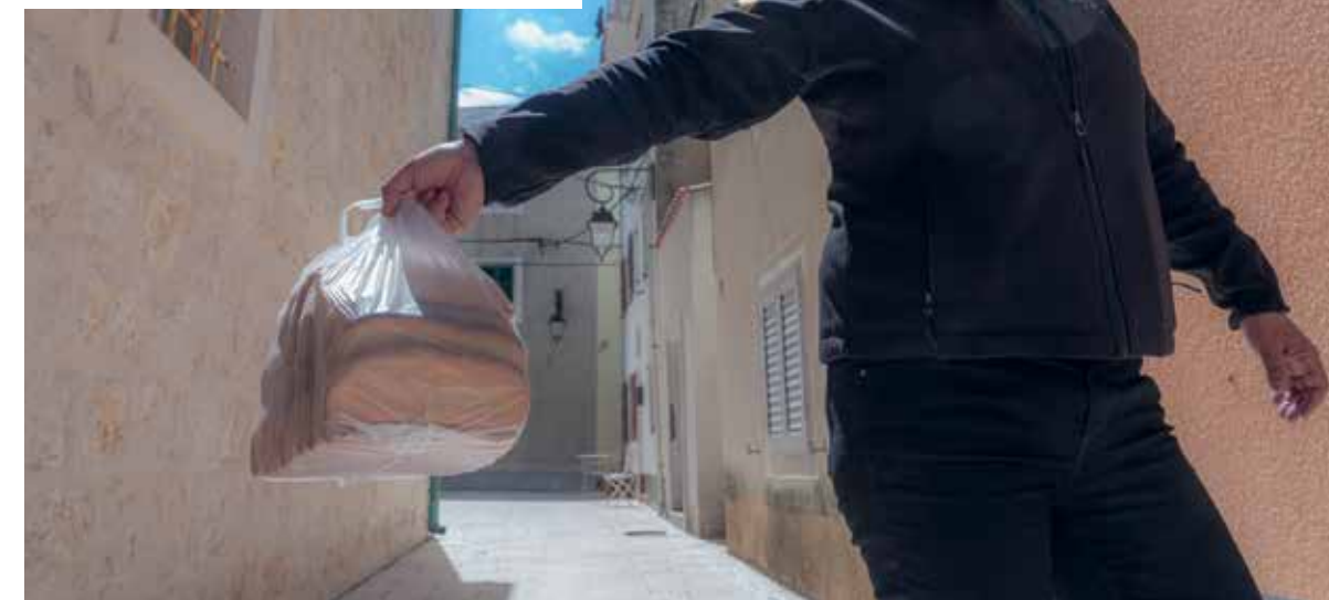
Baškotini tek kupljeni kod sestara benediktinki